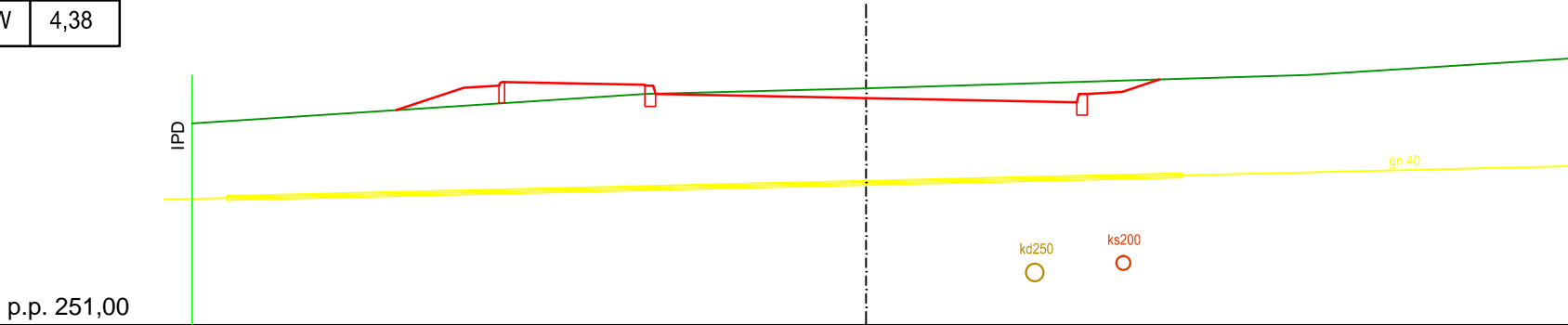
Przekrój Nr LP-03 Km 0+018,18